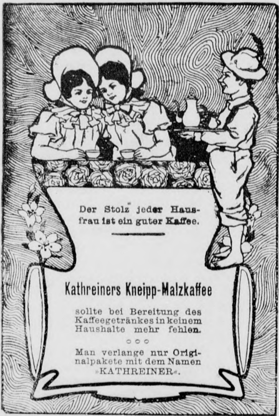
Der Stolz jeder Hausfrau ist ein guter Kaffee.