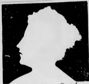
Ein heller Kopf verwendet stets

bei billigen Preisen und reeller Bedienung. Ruckherzu Nr. 14. Telefon Nr. 169.