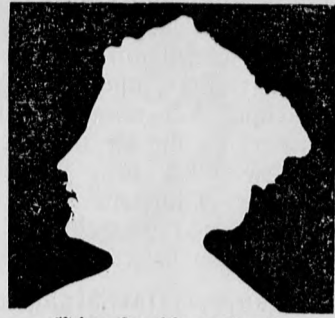
Ein heller Kopf verwendet stets