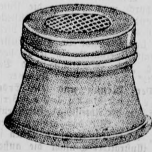
Figur 1. Preis per Stück Kronen 2.—

Hunderttausende Menschen werden jährlich durch Einatmung krankhafter Bazillen in Ungarn hinweggerafft, worunter laut statistischem Ausweise an der Tuberkulose allein Achtzigtausend zugrunde gehen, daher die berechtigte Angst vor Einatmung böser Bazillen, welche den grössten Teil des telephonierenden Publikums stets erfasst, wenn selbes ein Telefon benützt, welches auch von verschiedenen Menschen in Anspruch genommen wird. Diese Angst ist nun durch Anschaffung der durch viele hervorragende Ärzte empfohlenen, stets bei sich tragbaren und mit impregnierter Einlage versehenen