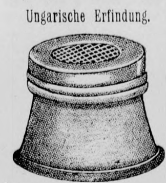
Figur 1. Preis per Stück Kronen 2.—

Hunderttausende Menschen werden jährlich durch Einatmung krankhafter Bazillen in Ungarn hinweggerafft, worunter laut statistischem Ausweise an der Tuberkulose allein Achtzigtausend zugrunde gehen.