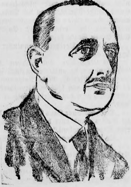
Nationalrat Streeruwitz — Bundestanzler von Oesterreich.

Ein herzliches „Willkommen!“ schalle den österreichischen Touristen entgegen, die morgen Sonntag unsere Stadt und deren herrliche Umgebung mit ihrem lieben Besuche beehren. Mit einem Gefühl stiller Freude begrüßen wir sie in unseren Mauern und der warme Händedruck, mit dem wir sie empfangen, sei ein Zeichen unserer aufrichtigen Freundschaft. „Willkommen!“ Diesen schönen Gruß rufen wir den Mitgliedern des Österreichischen Touristenklubs, Sektion Wiener-Neustadt, zu, die jetzt auf Einladung des Transdanubischen Touristenvereines zu Beginn der Saison unseren