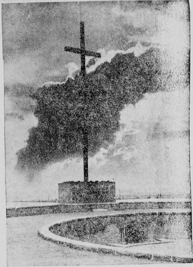
Düsseldorf: Schlageter-Kreuz. National-Ehrenmal.

In der Nähe des Flughafens inmitten der Holzheimerheide, ragt das Schlageter-Kreuz zum Himmel.