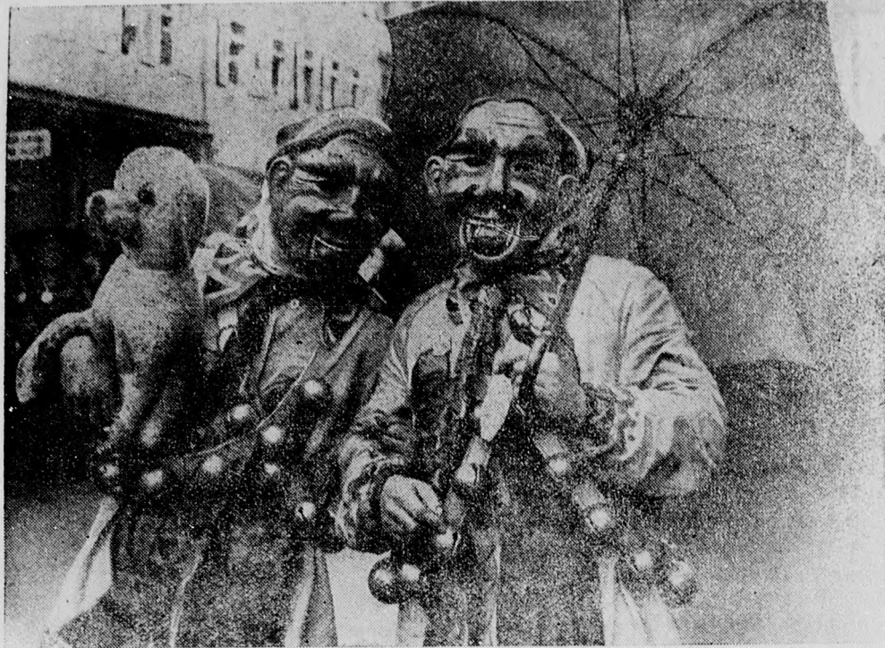
Fröhliche Fastnacht im Schwarzwald. Bonndorfer „Pflaumenkluder“.