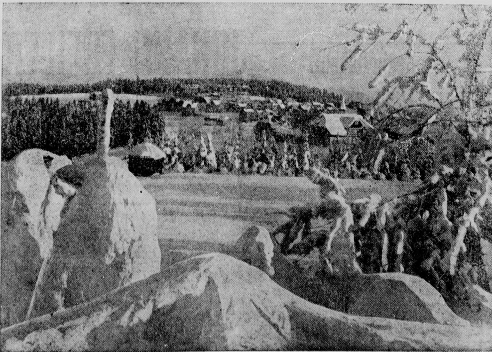
Winter in Thüringen: Oberhof im Neuschnee.

ist infolge der drohenden Haltung Italiens ein Kurssturz zu verzeichnen.