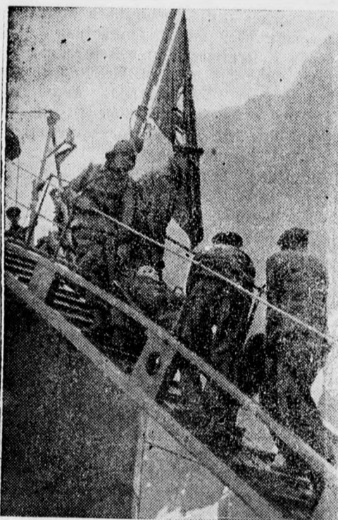
Ein Schwerverletzter des Ueberfalles der Engländer wird über das Fallreep von Bord der „Altmark“ an Land gebracht.

Auf Initiative der vatikanischen Bibliothek ist kürzlich die im Jahre 1548 von dem italienischen Geographen Giacomo Castaldi verfertigte Landkarte herausgegeben worden, die er von den Donaufstaaten und den benachbarten Gebieten zusammengestellt hatte.