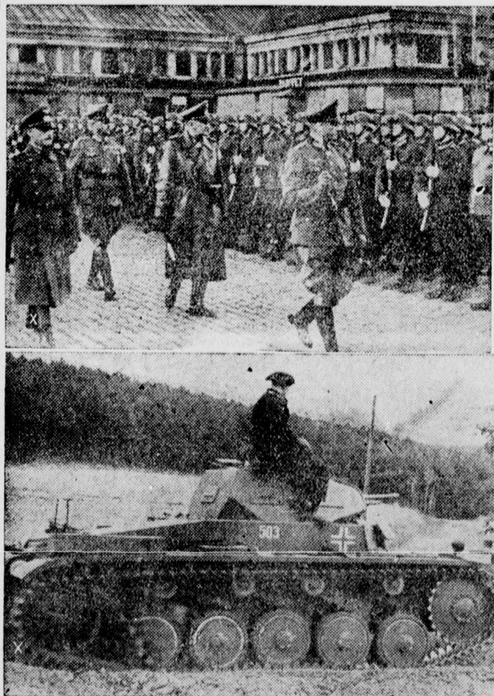
Generalfeldmarschall von Brauchitsch in einer französischen Stadt.