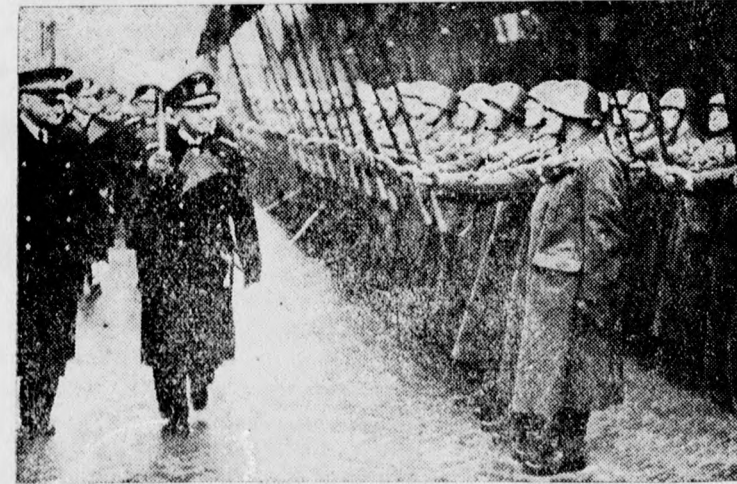
Bild oben: Der ungarische Honvédminister vitéz Bartha auf einer Besichtigungsfahrt im besetzten Westen. — Bild unten: Großadmiral Raeder (rechts) in Begleitung von Admiral Riccardi die Front der angetretenen Ehrenformation ab.