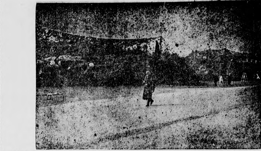
Auf einem Feldflughafen der deutschen Luftwaffe an der Südostfront. — Ein Heinkel-Kampfflugzeug ist zum Start gegen den Feind bereit. (A. G.)

Mit Wirkung vom 8. April 1941 mache ich die Ausreise ausländischer Staatsbürger von einer Ausreisebewilligung abhängig. Ich ordne deshalb an, daß jeder ausländische Staatsbürger, der das Land verlassen will, sich vor seiner Abreise in Budapest bei der Landeszentralbehörde für Fremdenkontrolle (Fövämlér 8, I., 128) zwecks Einholung eines Ausreisefestvermerks melde. Bei der Meldung sind Reisedokumente, Meldebescheinigung, Wohnungszertifikate oder Aufenthaltbewilligung vorzuweisen, denn die Landeszentralbehörde für Fremdenkon-