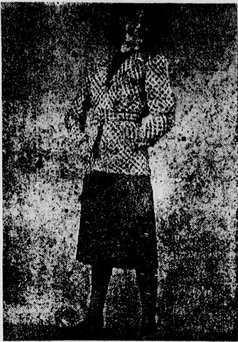
Für junge Mädchen: Sportkostüm. Schwarz-weiß karierte Jacke in Herrensform mit Ringsgurt, aufgesetzten Taschen und weitem Faltenrock, einfarbig. (A. G.)