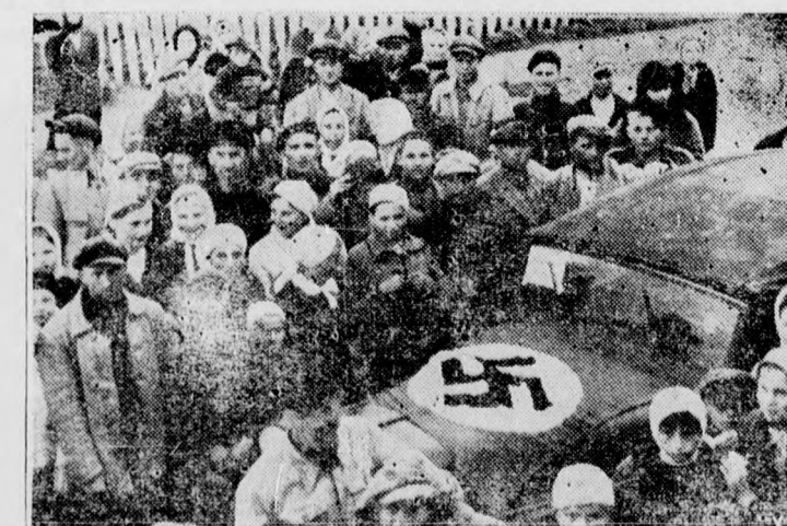
Bild oben: Verlassen und kampfunfähig liegen zahlreiche Panzerwagen der Sowjets am Straßenrand. — Bild unten: Die litauische Bevölkerung freut sich immer wieder, wenn die siegreichen deutschen Truppen durchmarschieren. (F. 3.)