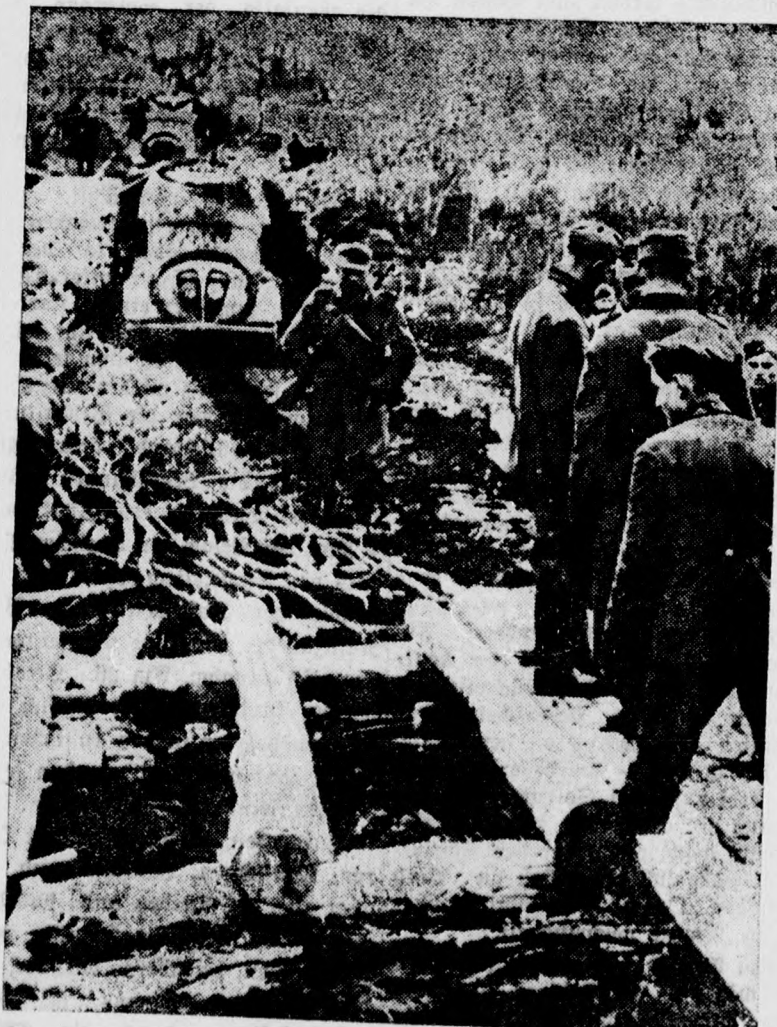
Schnell wird ein passierbarer Weg herge stellt, und der Vormarsch kann ungehindert weitergehen. (F. 3.)