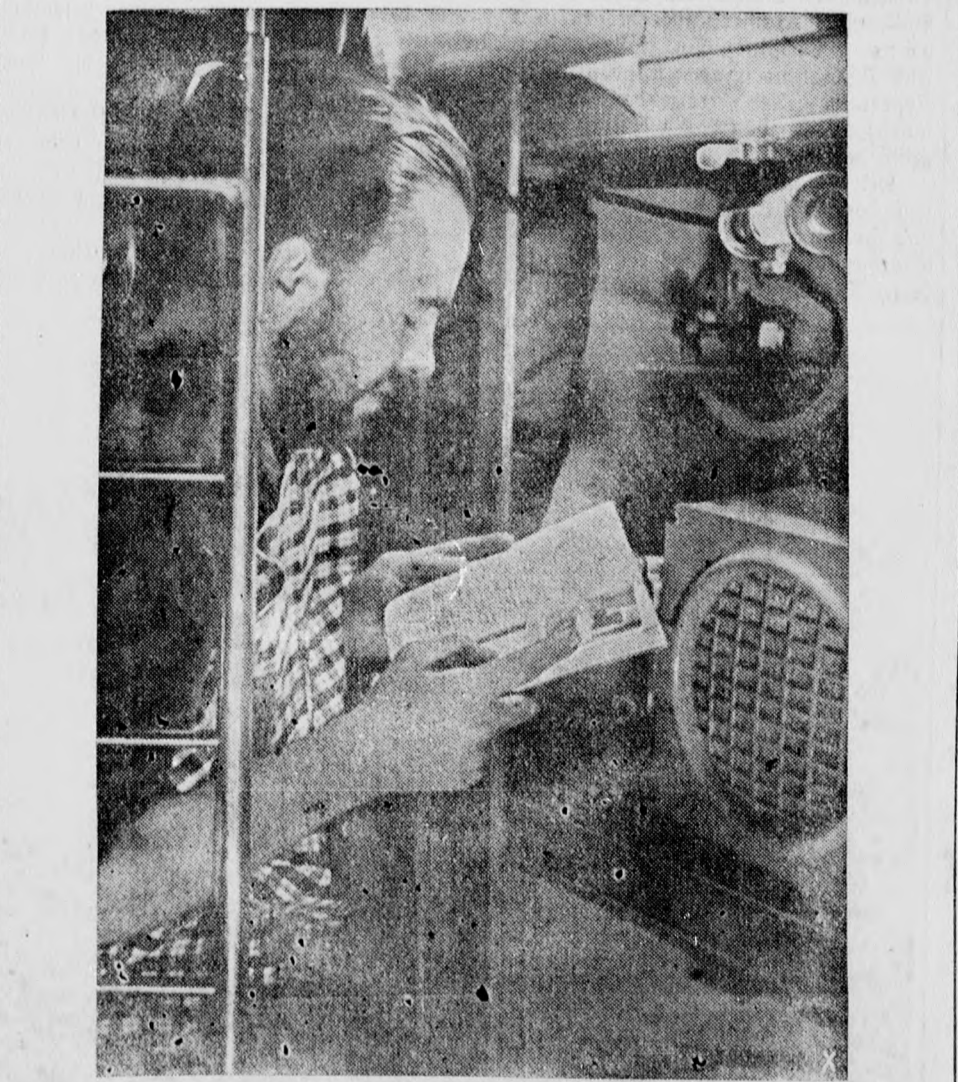
Auf einem deutschen U-Boot. — Die Wartezeit auf dem U-Boot verkürzt ein Buch, und das Radio liefert dazu die Musik.

Berlin, 19. Jan. Dem nordafrikanischen Kriegsschauplatz kommt nach deutscher Ansicht für die Gesamt-Kriegsführung der Dreierpaktmächte insofern eine besondere Bedeutung zu, als hier sehr starke englische Kräfte eingesetzt und gebunden sind und also dem britischen Empire für den Kampf im Ostasien nicht zur