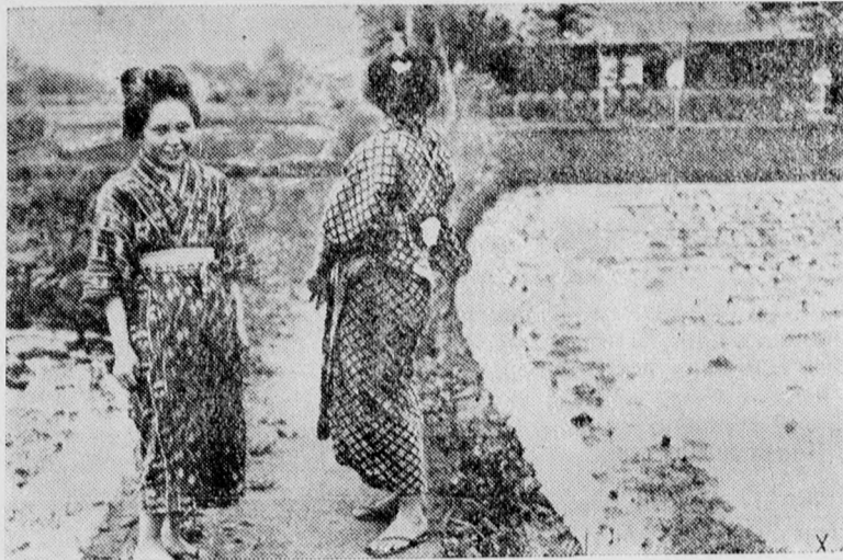
Japanische Geishas in einem Reisfeld

Bitte! Unserer heutigen Gesamtaufgabe liegt ein Einzahlungsschein bei und ersuchen wir unsere geschätzten, im Rückstand befindlichen Abonnenten, um gütige Ueberweisung des fälligen Abonnementbetrages. Zur geneigten Orientierung diene, daß das Abonnement per Monat 2 80 Pengö beträgt. Hochachtungsvoll Verwaltung der „Debenburger Zeitung“