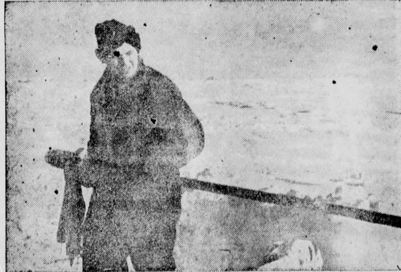
Bild oben: Ein Pferdehirt von einem freilebenden Bergstamm am Fuße des Elbrus-Gebirges. — Bild unten: Reinigen der schweren Geschütze an der Ostfront bei Schnee und 20 Grad Kälte.