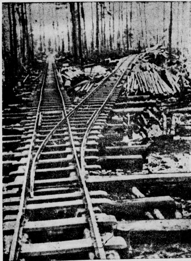
Lebensadern der Kriegführung. — Eine Feldbahn im Osten.

Die Einwohnerschaft werde umgebracht, mit der Begründung, daß sie unter dem Schutz der deutschen Wehrmacht ihr wahres Gesicht gezeigt und ihre antibolschewistischen Gefühle frei geäußert und verwirklicht habe. Damit habe sie das Recht verweigert, in der Sowjetunion weiterzuleben.