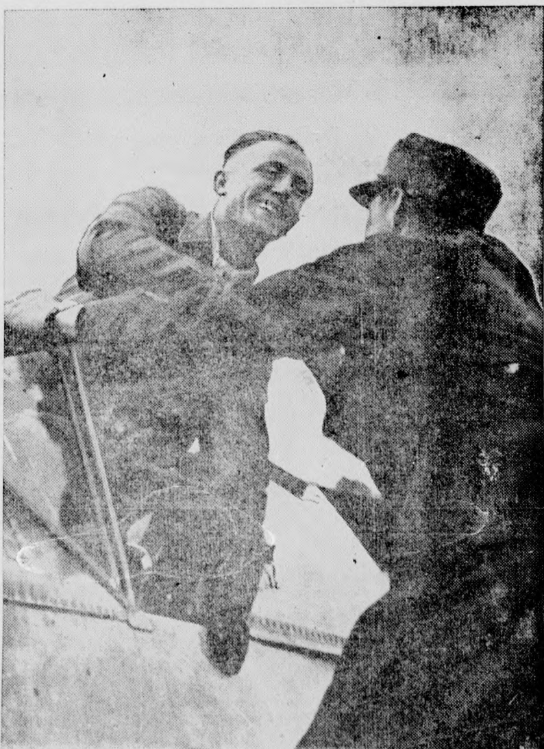
Ein junger Jagdflieger kehrt von seinem Flug zurück und wird beglückwünscht.

Espende für unsere Soldaten an der Front! Espenden übernimmt der Rotkreuzverein.