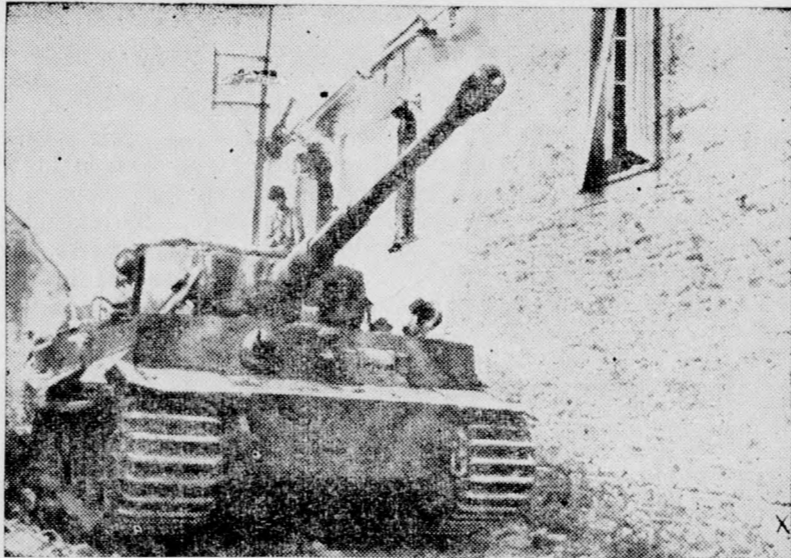
In engen Straßen in der Normandie rollen die Tiger-Panzer zum Kampfe vor.

Fliegeralarm. Gestern vormittags kam es in unserer Stadt zu einem Fliegeralarm, der mehrere Stunden währte. Flindflugzeuge überflogen die Stadt nicht. Gestern wurde in unserer Stadt zum erstenmal das neue Warnungszeichen gegeben (Einfluggefahr!). Kurz darauf erfolgte der Fliegeralarm.