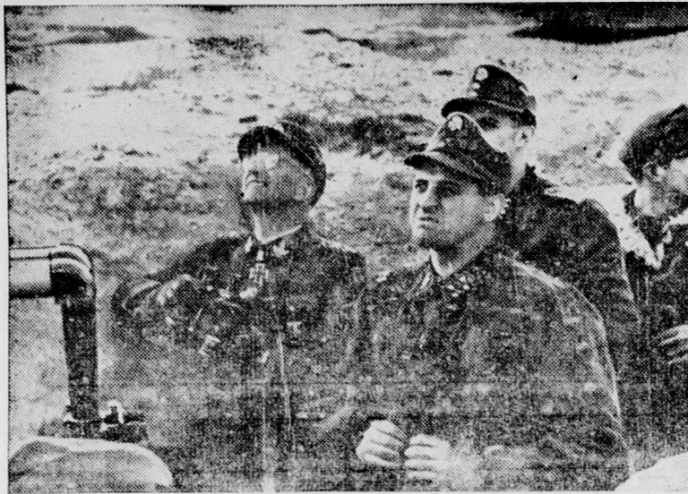
Deutsche Schlachtfieger greifen in die Erdkämpfe ein. Am Beobachtungsposten. (3)