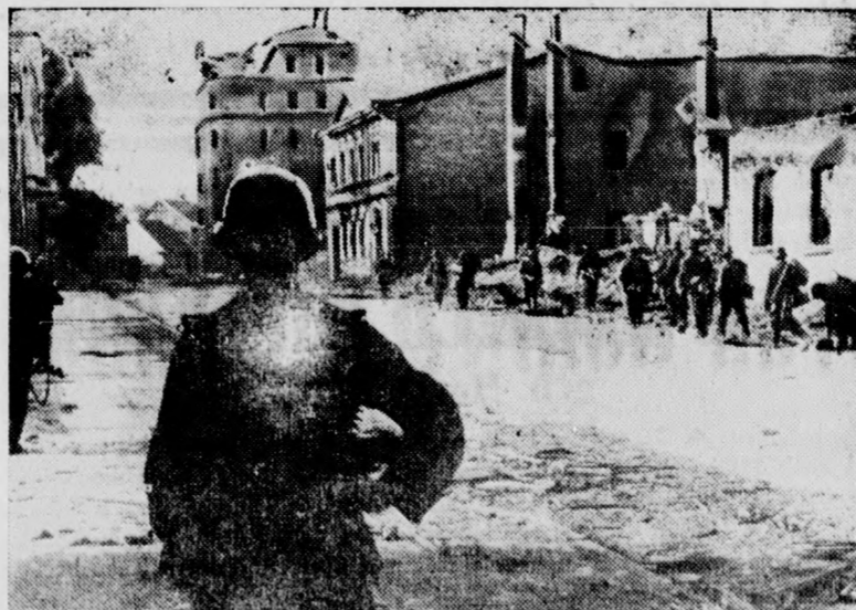
An den Häuserruinen einer lettischen Stadt entlang gehen deutsche Grenadiere dem Feinde nach.

Die Leistung gestaltete die Rolle zu einem künstlerischen Erfolg, an dem auch der elegante Julius Kamarás als Banddirektor reichlichen Anteil nahm. Die aparte Erscheinung und das temperamentvolle Spiel Iby Szabós fand gleichfalls gute Aufnahme beim Publikum. Alexander Bánóly ergänzte vorzüglich dieses Künstlertrio. Zu dem Erfolg des Abends leisteten reichlichen Beitrag Gyöző Dani és und Ludwig Kormos. Eine urkomische