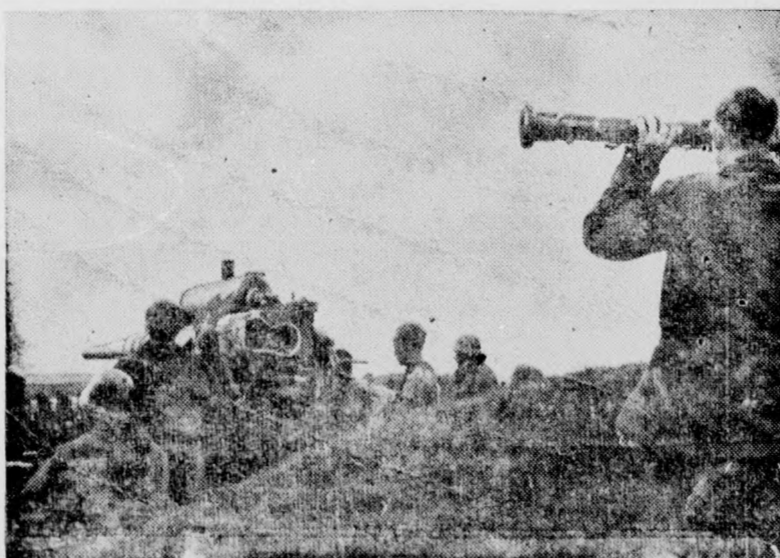
Der Geschützführer der Flak hat Panzer festgestellt. Mit Ruhe erwartet die Geschützbedienung den Feuerbefehl.