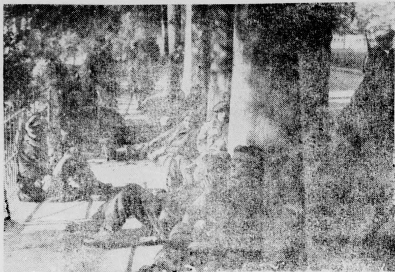
Gefangengenommene Engländer erwarten in Holland ihren Abtransport. (T)

DIE MOTTEN kommen nicht in Ihre Kleider, Betten und Pelzsachen, wenn Sie Taufouchi, das japanische Mottenkraut, aus der Drogerie Franz Müller, Grabenrunde 52, angewandt hätten!