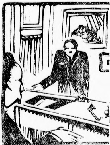
Kegyelmes Uram! W. M. 12. eltűnt...

— Eltűnt?!... — kérdezte nyugtalanul az államtitkar.