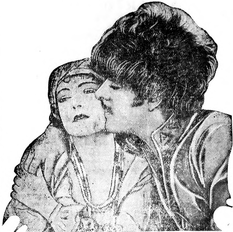
RENEE ADOREE and JOHN GILBERT in "THE CROSSINGS"

főszereplésével kerül bemutatásra ma este fél 9 órai kezdettel az Uránia kertmoziban ez a szenzációs világhittraktió, mely az orosz kozákeletből egy viszontagsággal tele szerelmi történetet mutat be. Kísérő műsora is szenzáció számba megy a „Nősüljön meg hadnagy ur” című vig történet.