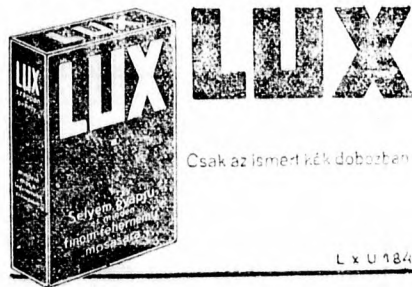
Csak az ismert kék dobozban

Fehérnemű selyem-és műselyemből Lux-xal való helyes ápolás mellett, ép oly tartós, mint a vászon.