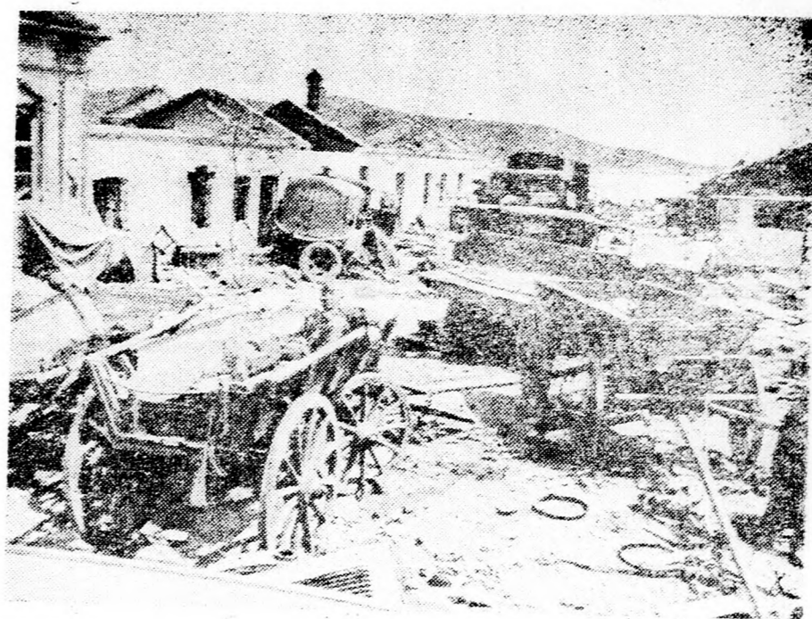
Itt jártak a Stukák! A szovjet utánpótlást pusztítják a német és szövetséges repülők. Amint a képek mutatják, kellő eredményei