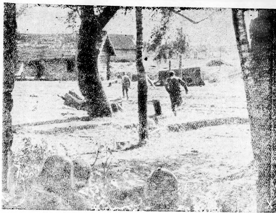
Orvlövész bandákat tesznek ártalmatlanná a német és szövetséges megszálló csapatok Oroszországban