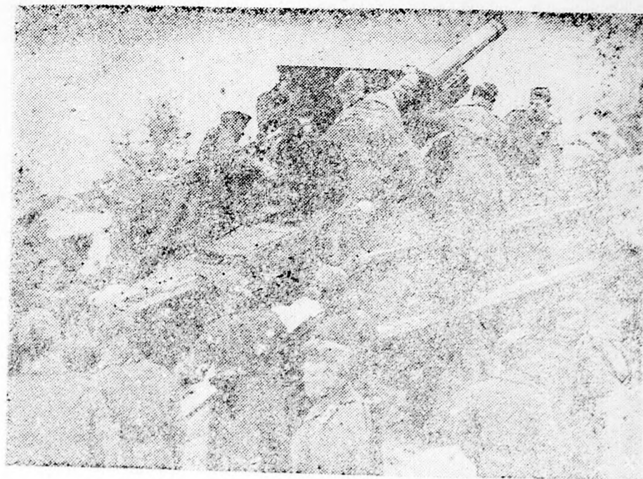
Képek a német űzérseg életéből.