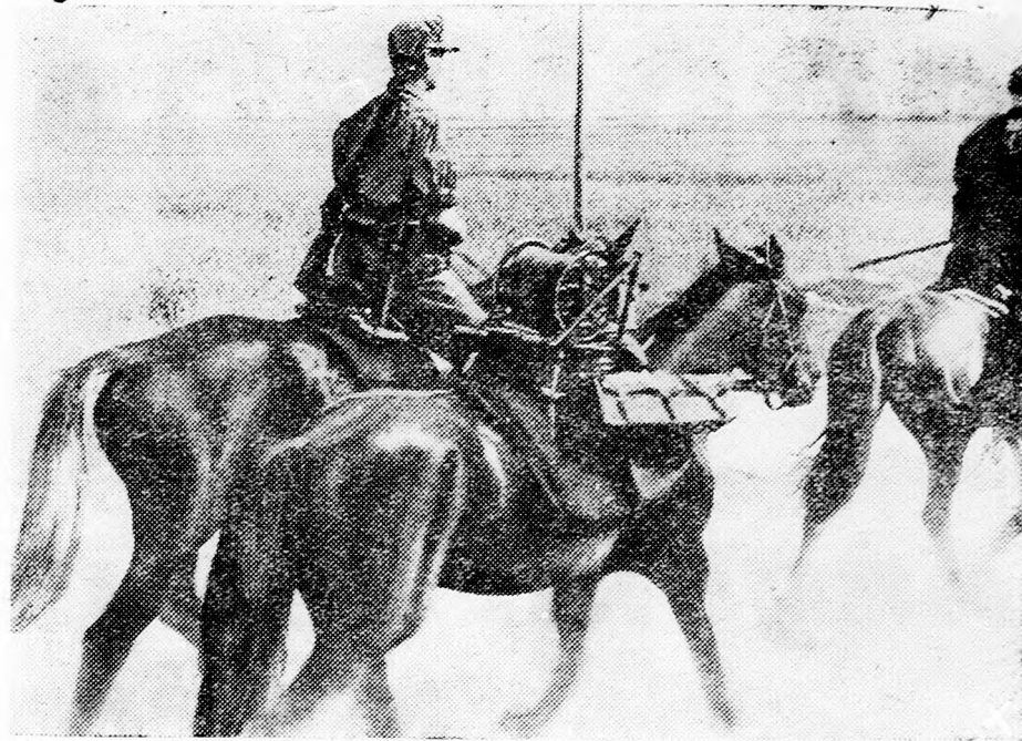
A modern háboru sem nélkülözheti a lovasságot. A műszaki és híradós alakulatoknál jó szolgálatot tesznek a lovak és fontos szerepük van a gyorsan mozgó önálló lovas csapatoknak is.