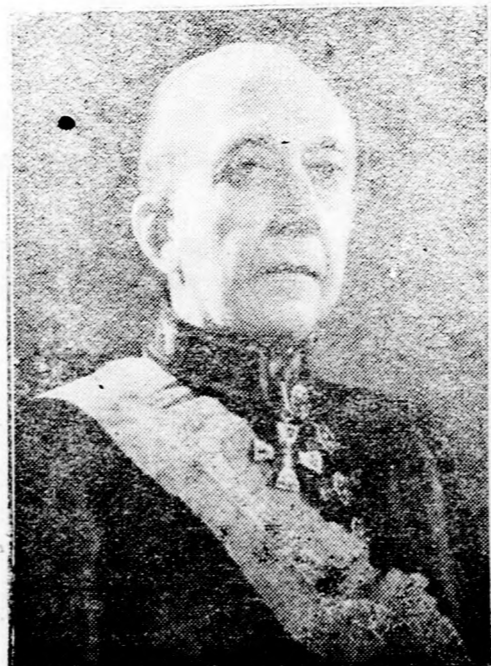
Gyhyczy Jenő külügyminiszter