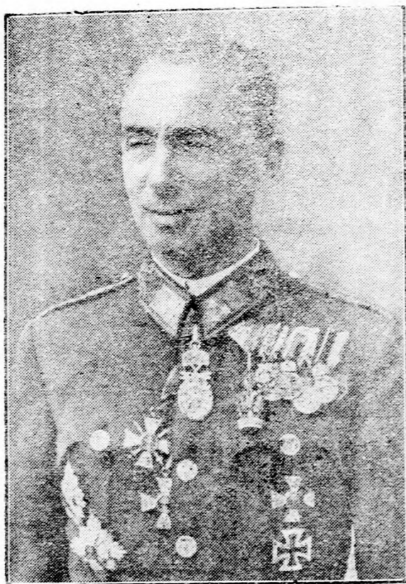
Csataj Csataj Lajos vezérezredes az új honvédelmi miniszter