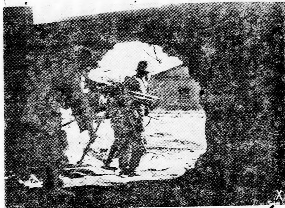
A német őriaspánciók. a Tigrisek előtt nem akadály a feltartóztatásukra huzott mély árok sem Biegorod körül. A város birtokáért rendkívül súlyos harcok folytak a romok között.