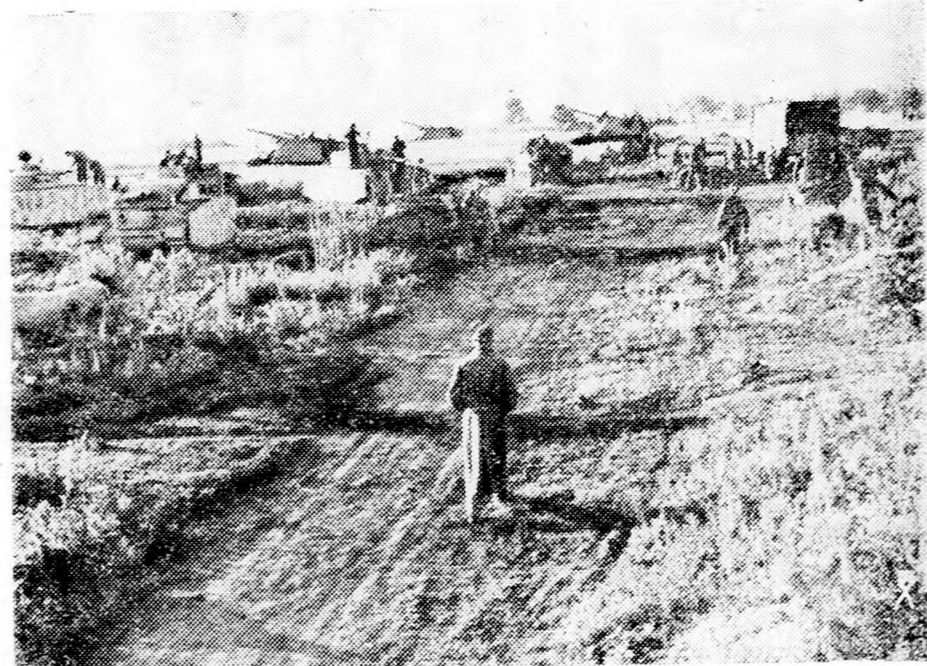
Charkov környékén a páncélosok és a nehéztüzérség lövi az újabb rohamokra gyülekező bolsevista csapatokat.