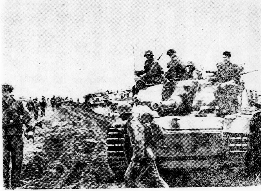
Charkov körül újabb nagy összecsapásra készülődnek a német szovjet csapatok. Nagy tömegekben vonul fel a német páncélos és gyalogos haderő a küzdelemre.