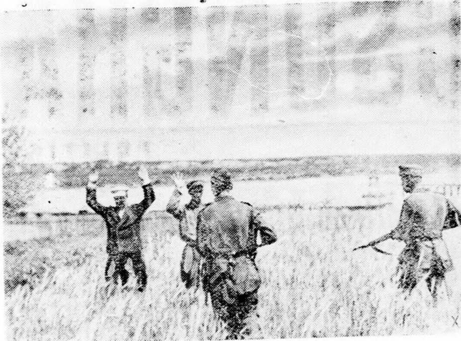
Harc a szovjet partizánok ellen. Vetések, házmokok körül nagy tömegekben szedik össze a német megszálló csapatok a bolseviszta orvlövészeket.