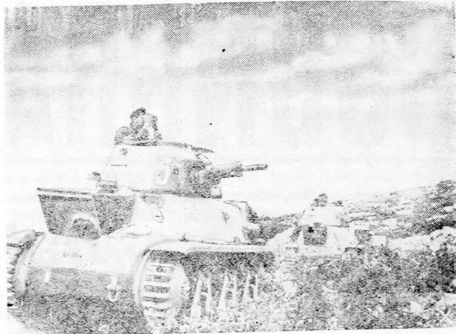
A délolaszországi hadszíntéren is megjelentek a német Tigris páncélosok és eredményesen avatkoznak bele az elhárító küzdelembe