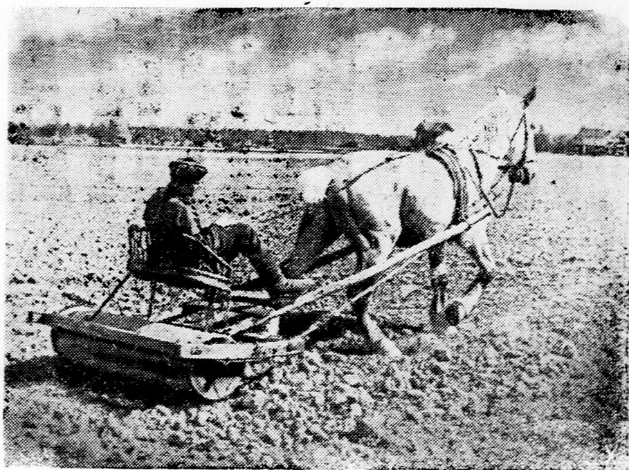
Békés termelő munka a front mögött. Német munkaszolgálatosok végzik az őszi szántást vetést a megszállt Oroszországban.