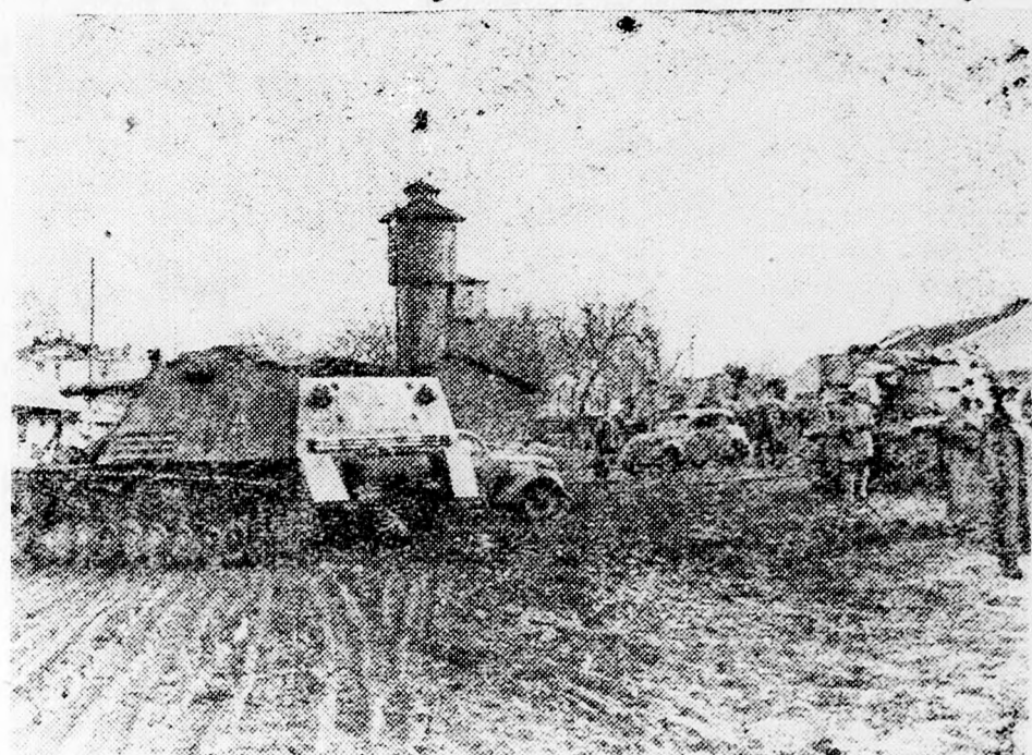
Kirovgrádnál különösen nagy veszteségeket szenvedtek a bolsevisták az elmúlt napokban, anélkül, hogy áttörhették volna a német arcvonalat. A Tigrisek a szovjet páncélosok százait lötték ki és semmisítették meg.