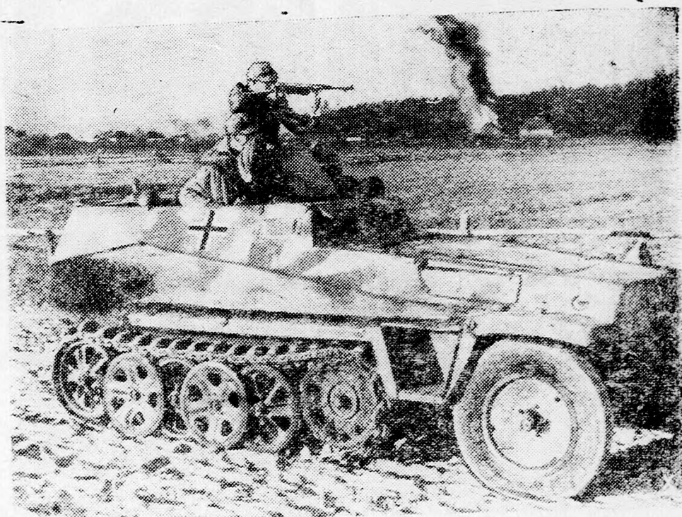
Dél-Olaszországban hősiesszen harcol a Goring páncélos hadosztály. A különösen kiképzett és felszerelt német páncélos csapatokkal nem bír az angol-szász tulerő a legnagyobb ember és anyaváldozat ellenére sem.