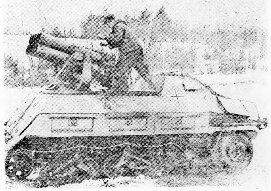
Páncélosokra szerelve használják keleten a németek a leghatásosabb fegyvert, a ködvetőt. Az új fegyver borzalmas pusztításokat visz végbe a támadó bolsevisták soraiban.