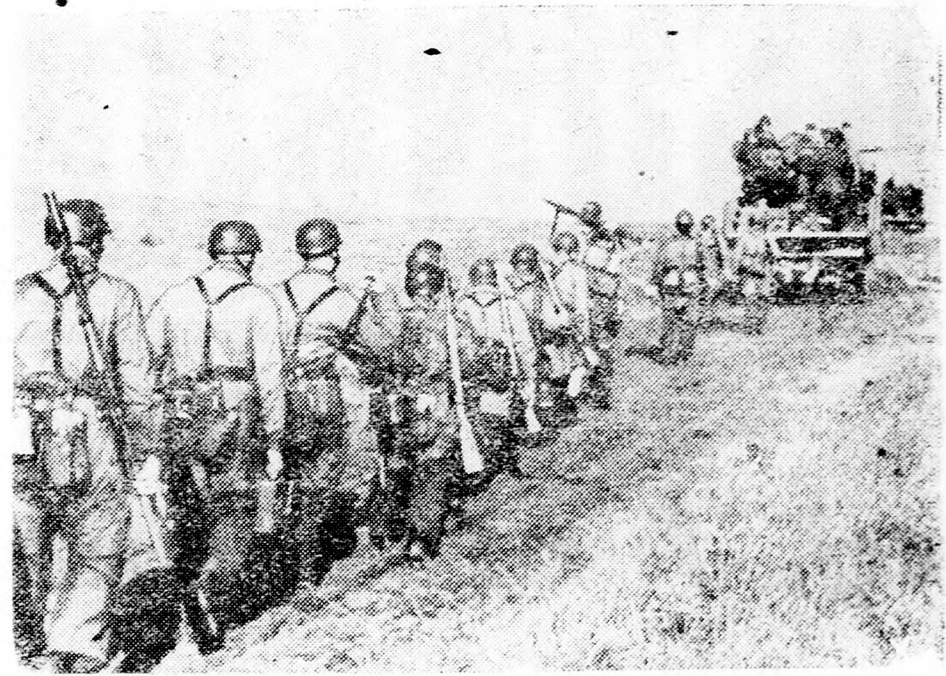
Utban a hadszíntér felé. Hatalmas német tartalékok vonulnak fel a keleti front déli részén, a sorsdöntő küzdelemre a bolszevisták ellen.