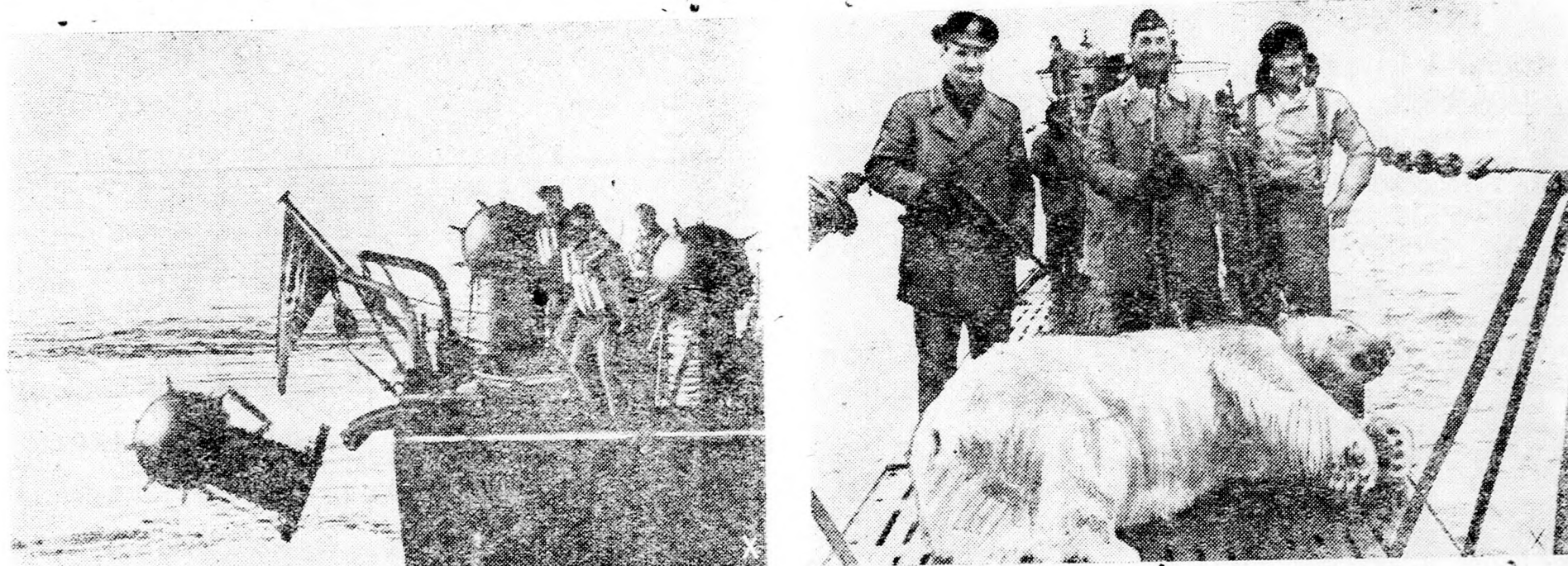
Német tengeri erők a magas északon aknákkal zárják el a norvég kikötőket. Az egyik tengeralattjáró legénysége örömmel tér hez a gazdag vadászsákmánnyal

A városi szegődményesek bérét, az általános és közismert körülményekre tekintettel, 1944 március 1 hatállyal felemelték. Körülbelül havonta 50 pengős fizetésjavítást kaptak a kocsi-sok, utászok, kerti munkások, mezőőrök és kézbesítők.