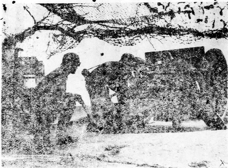
Az Atlanti Fal mögött a német tüzérség várja az inváziót, a lönyű és a legnehezebb ágyúk ezrei állanak, működésre készen egyrészt a partok felőli, másrészt a légítámadások elhárítására.