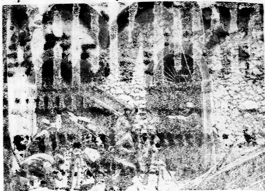
Cassino romjai körül ismét rendkívül heves harcok dúlnak. Német páncélos gránátosok csodálatos hősiességgel verik vissza az ellenség tulerő rohamait.

lyes. A hadszíntér többi részén kölcsönös tűzérési és élénk fel- derítő tevékenység volt, honvéd csapataink a bolsevisták zé- lajnyi erővel végrehajtott vállalkozásait hiusították meg. A hadi jelentéssel kapcsolatos katonai magyarázat rámutat arra, hogy az elmúlt napokban csapataink igen kemény harcot vívtak a bolse- vistákkal, akik hat nap óta támadták állásainkat. Az elhárító har- cokban különösen a budapesti környéki és északi-déli csapataink tűntek ki, akiket német páncélos gránátos kötelékek támogattak és a német légiőrségek igen határozottan segítettek. A harcok során csapataink 12 szovjet páncélost semmisítettek meg és 2 repülőgépet löttek le. A szovjet támadások sehol sem érték el céljukat, honvéd csapataink a helyi betöréseket elreteszelték és a nyomban megindított ellentámadásokkal az ellenséget eredeti vo- nalára vetették vissza. Sok bolsevista vállalkozás már a saját vonaluk előtt összeomlott. Az elhárító küzdelemben kiválóan állta meg helyét a 33/1 hegyvidéki századunk.