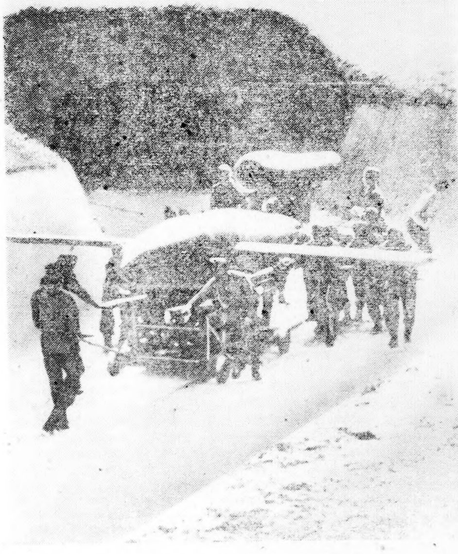
A V. 1. és a német nehézgépek tüze szünet nélkül zudul Londonra és keletangliai célpontokra. Egyre súlyosabb gond az angolszász inváziós csapatok utánpótlási nehézsége.