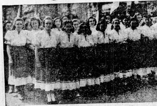
győri helyi csoportunk kultúrőrdájának népi táncosportját a választások alatt végzett lelkes, jó munkájáért.