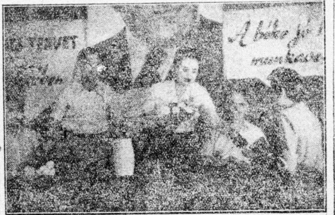
Díjkiosztás a Külforgalmi N. V.-nél

A Külforgalmi NV 16 újítója kapott munkajutalmat, közöttük számszámban olyanok, akik a SZIT soraiba tartoznak. A jutalmazottak megígérték, hogy fokozott munkabizonyítást adnak a hűségük és a Párt-hoz.