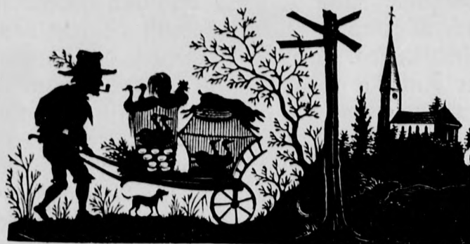
Von unserem Schwarzfilmfiter.