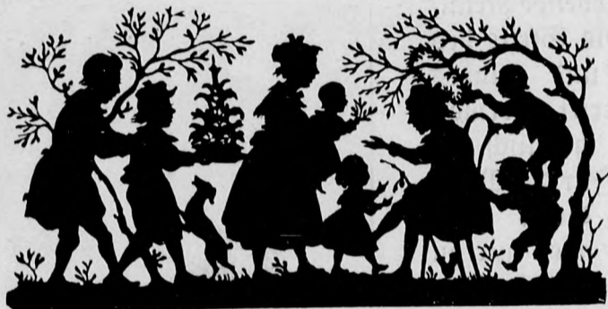
Von unserem Schwarzkünstler.

Der eine Mitspieler steht in einer Vertiefung, z. B. in einem Graben ohne Wasser, die andern oben am Rande. Sie halten dem untenstehenden Wassermann die Hand hin, rufend: „Wassermannchen, du bist allein, zieh' mich doch zu dir hinein!“ Der Wassermann ergreift eine der Hände, um seinerseits den betreffenden Mitspieler hinabzuziehen. Dann springen aber die übrigen hinzu, ihrem Kameraden zur Hilfe. Wer vom Wassermann hinabgezogen wird hat dann als ein Verbündeter ihm zu helfen.