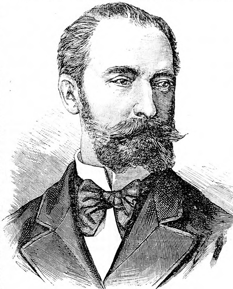
SADI CARNOT, Franciaország volt elnöke.

S ha többet semmit nem mondott volna azt világosan is félreérthetetlenül kimondotta, hogy a polgári házasság ellenkezik a katolikus vallással, hogy azt kath. embernek megszavazni nem szabad, sőt bűn, engyenlő a hittagadással.