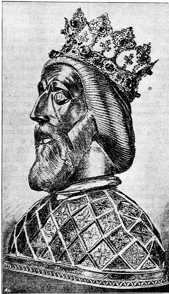
Sz. László király fejéreklyéje.

Az se jó, amit ellenfeleink csinálnak, az se, amit mi csinálunk. Ők minket támadnak, mi pedig — őket erősítjük. A katolikusok ellen való határtalan gyűlölet egy vad pártot hozott létre a kálvinisták, zsidók és szabadkőmivesek szövetségében, mely megsemmisítésünkre tör s mely a kath. egyház és vele együtt az állam romba döntésére es küldött. — Ezen egyesült kálvinista- és zsidópárttal tartanak a műkatolikusok is, kik magukat mindig és mindennütt jó katolikusoknak nevezik. (Hogy nem némulnak el örökre, midőn nyelvük a „jó katolikus” szót kimondja!) Ezek azon katolikusok úgy a világiak, mint az egyháziak közül, akik érdekből, koncrt megtagadják a kath. egyházat, megtagadják Krisztust. Igaz, külsőleg katolikusok, amennyiben még más vallásra át nem tértek, de belsejükben már hitelhagyottak. Nekik a katho-