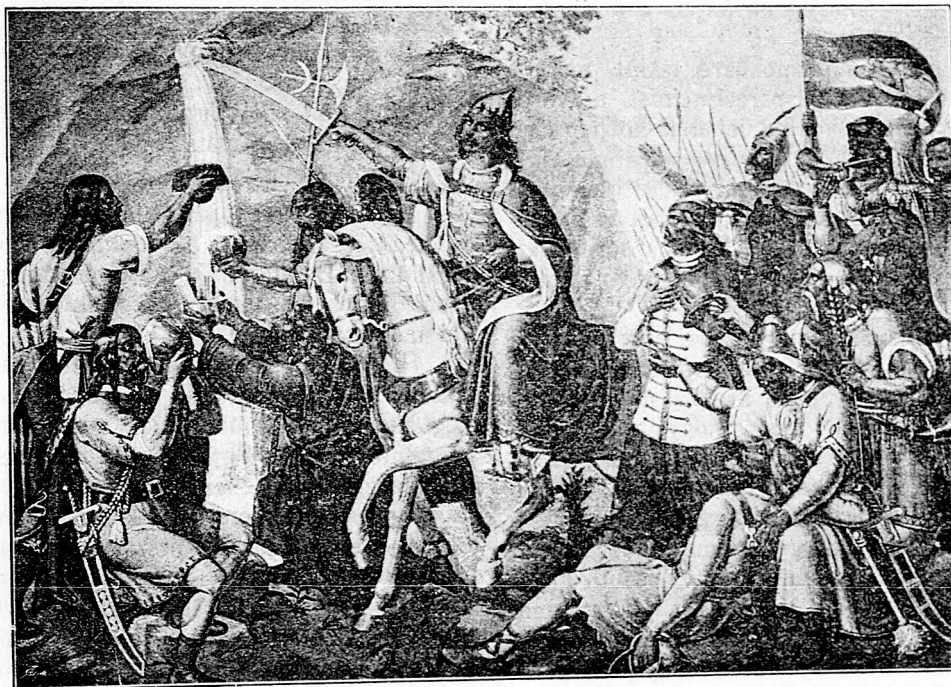
Sz. László király a sziklából forrást nyit.

hogyrészükre országos anyagi segélyt helyeztünk kilátásba. Négy százezer forintot kértünk is már e célra az országgyűléstől. Sokat pedig közülök kinevezünk három-négyezer forint fizetéssel polgári főanyakönyvvezetőnek. Ez által sokat lekenyerezünk és elnémitünk. Magyarorszá-