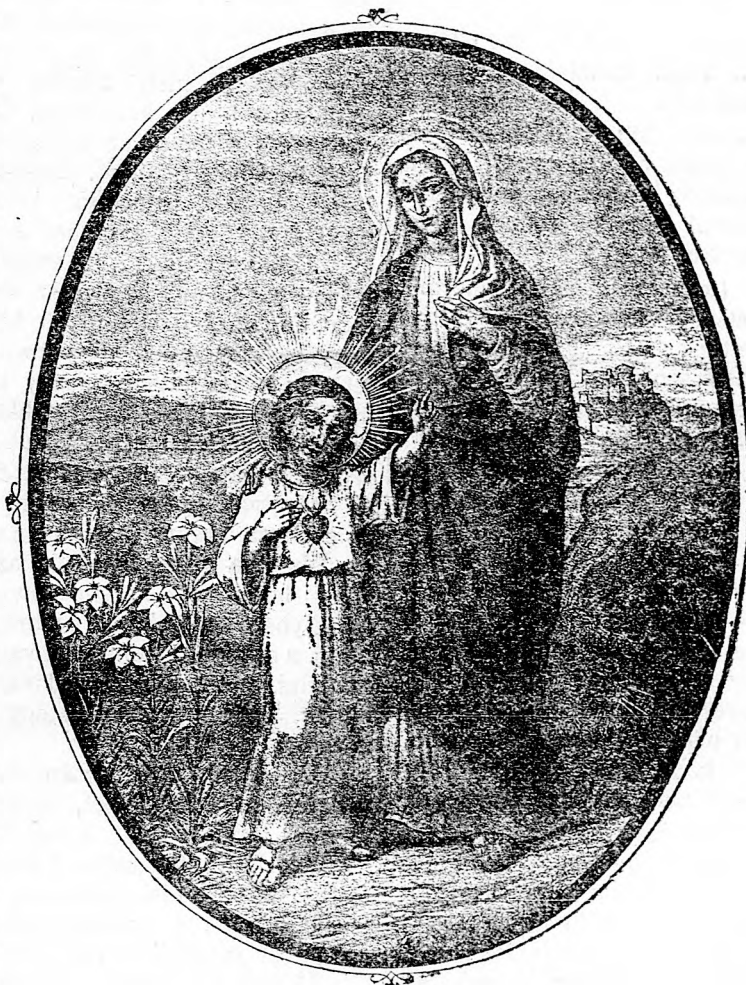
Jézus, Mária! Segíts!

Többnyire földmivelő emberek, a nép számára irván: képelem, mit gondol magában egyik-másik olvasó, mikor e címet betüzi. Azt gondolja: no ez igaz lehetett hajdan, de ma már másképp van. Az öreg apánk ugyanis fa ekével turták a földet, melyet az ég madarai trágyáztak meg, sarlóval aratták le a vetést, mégis széles feneket rakhattak az asztag alá. Mi ellenben műtrágyákat s acél ekéket használunk, még se megyünk semmi-re. — Méltán azt lehetne mondani, hogy apáink rosszul vetettek, de jól arattak; mi ellenben jól vetünk, de rosszul aratunk. — De hát nem oda Buda, édes atyámfia!